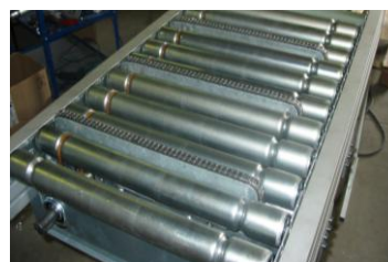
Transfert tri chaînes