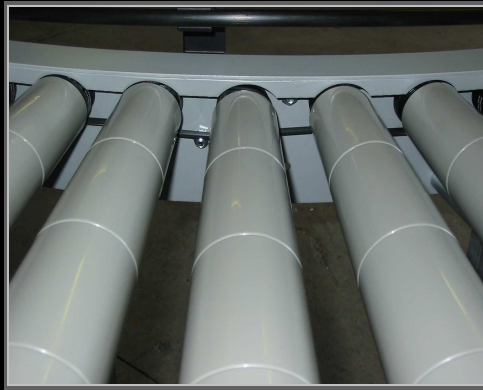
Carter de protection