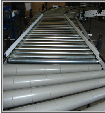
Partie droite et courbe

Ce convoyeur à rouleau est idéal pour la manutention de charges inférieures à 100 kg. La forme conique des rouleaux facilite le convoyage des charges dans la courbe. Les rouleaux sont reliés entre eux par des courroies striées conveyxonic armées entraînées par un motoréducteur asynchrone. Pour plus de sécurité, les courroies sont protégées par un carter.